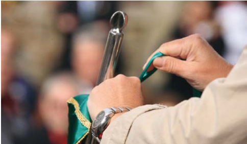
Encuentro a los Guiones e imposición de bandas conmemorativas.