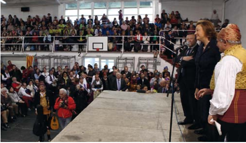
Presentación del gran Festival Folklórico.