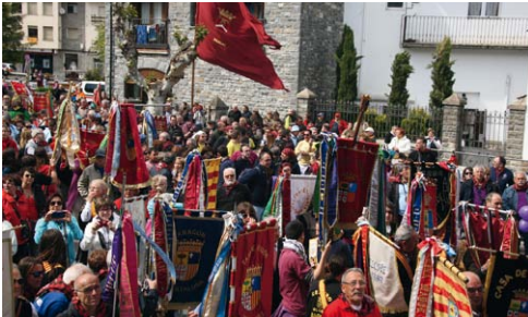
Encuentro de los asistentes en la Plaza del Ayuntamiento.