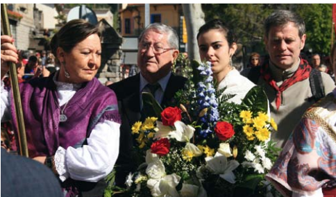
Tradicional ofrenda de flores y frutos.