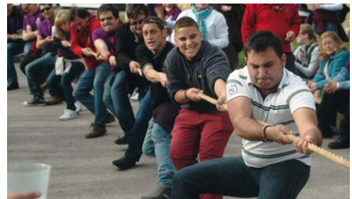
Celebración de juegos tradicionales aragoneses.