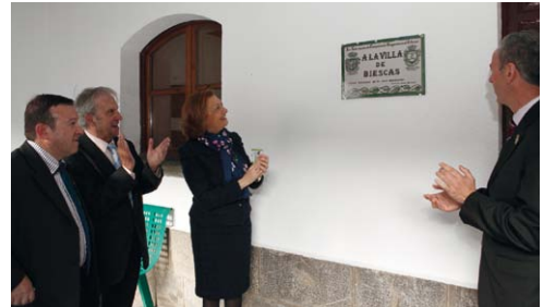
Descubrimiento de Placa Conmemorativa del Encuentro en la fachada del Ayuntamiento.