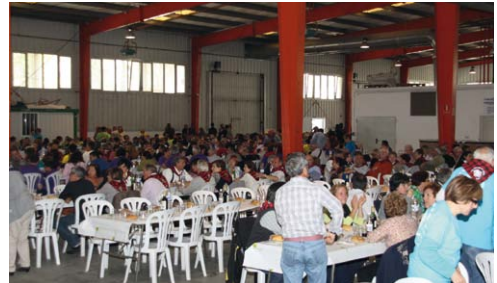
Comida de hermandad en Sabiñánigo con más de 2.000 asistentes.