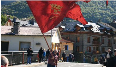
Ondeo de bandera por las calles de la Villa de Biescas.