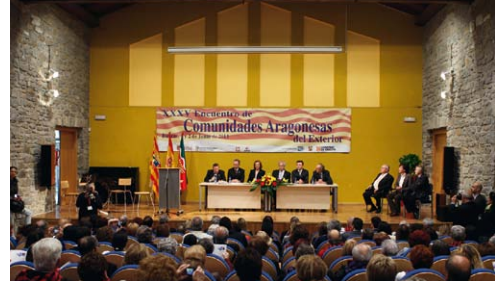
Vista del Acto Académico en el Centro Cultural Pablo Neruda.