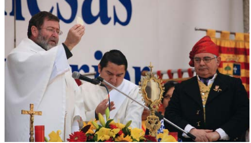
Misa aragonesa presidida por el cura párroco de Biescas.