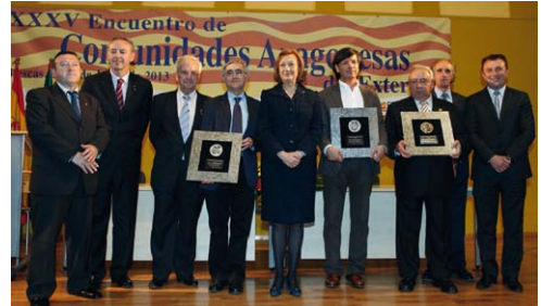
Foto de grupo de los Aragoneses de mérito 2013.