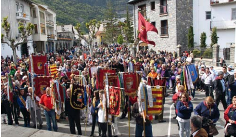
Bienvenida a las Casas y Centros asistentes.