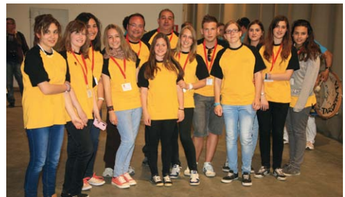
Jóvenes voluntarios del encuentro.