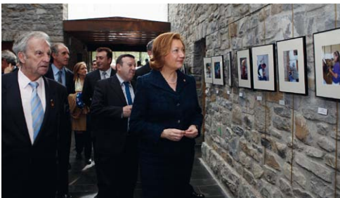
Inauguración de Exposición Fotográfica.