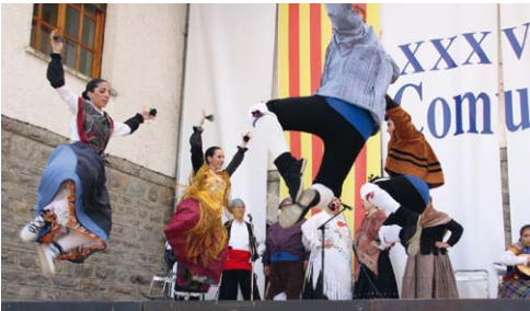
Actuación en el gran Festival Folklórico.